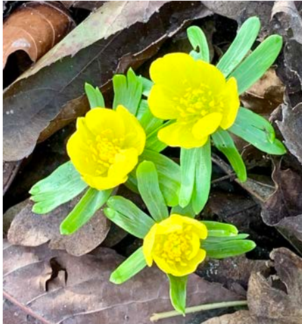
Winterakonieten op 1 januari 2022

Oidfa Nederland wenst jullie een goed en gezond 2022, waarin we elkaar weer zullen ontmoeten en hopelijk ook weer dingen samen kunnen doen.